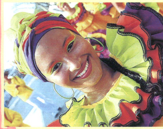
Au carnaval de Barranquilla, un des plus spectaculaires d'Amérique du Sud.

Comme de coutume, Pierre Brouwers nous brosse un tableau complet de la destination avant de nous convier à la découverte d'un pays planté tout au nord de la Cordillère des Andes. Autant dire que l'altitude, les Colombiens connaissent. La capitale Bogotá est ainsi posée à 2600 m. Son joli cœur historique, qui semble tout droit venu d'Andalousie, contraste avec d'interminables banlieues. Entre montagne et mer, la Colombie offre des paysages d'une grande variété, des vestiges d'un passé colonial en