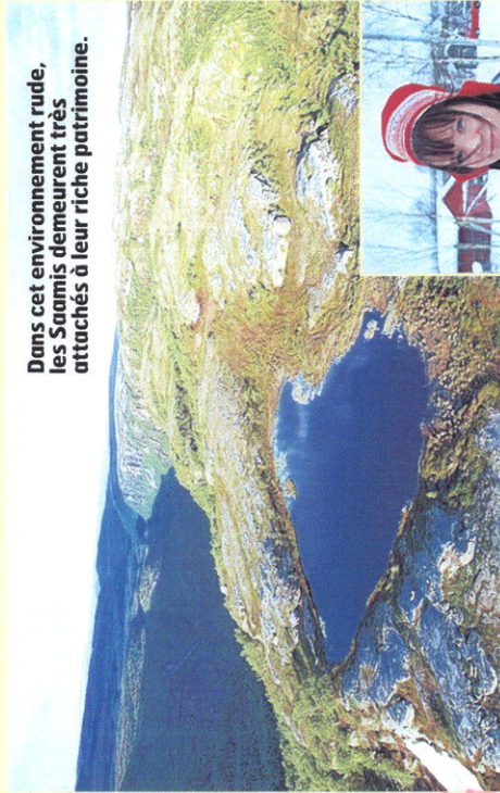
Dans cet environnement rude, les Saamis demeurent très attachés à leur riche patrimoine.

Les cuisinières, farouches gardiennes de la tradition.